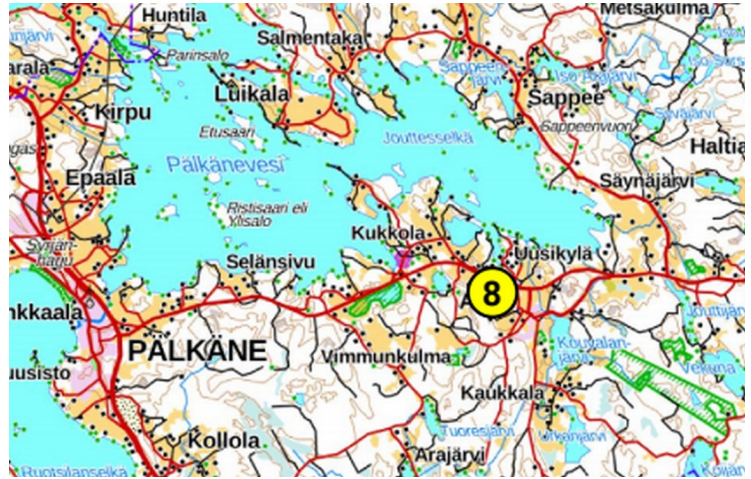
Häyläsuo sijaitsee Aitoontien eteläpuolella.

Häyläsuon ylälaitaan rakennetaan kosteikko. Sen kaivumailla parannetaan alavia pelloja. Kosteikon alapuolella Häyläsuon oja muutetaan kaksitasoumaksi 900 metrin matkalla. Ojan sivuhaarojen vettä pidätellään putkipatojen avulla, jotta suo ei kuivu. Kosteikko ja kaksitasouoma pidättelevät kiintoainetta ja ravinteita. Kosteikosta muodostuu monimuotoinen luonto- ja maisemakohde.