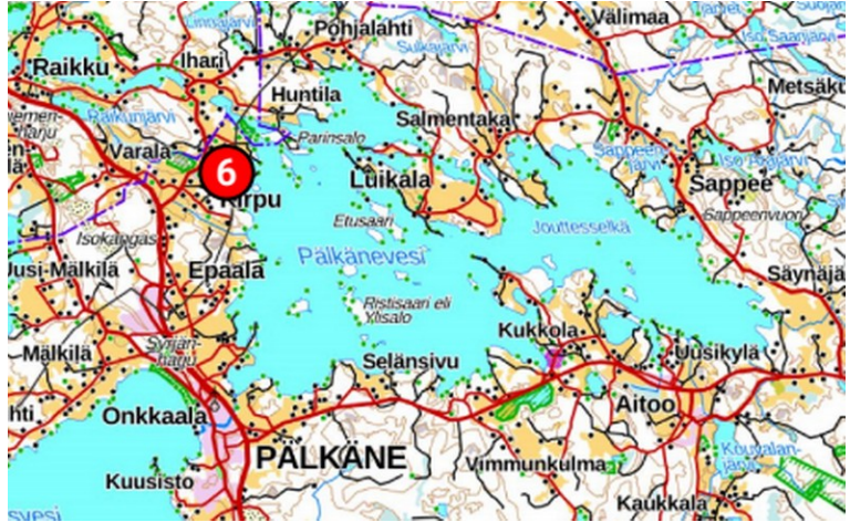
Korteoja sijaitsee Pälkäneveden itärannalla.

Oja kerää vettä laajalta valuma-alueelta, joka alkaa Pihkonsuolta Raikunjärven eteläpuolelta. Oja kulkee pääosin peltoaukean viljelymailla.