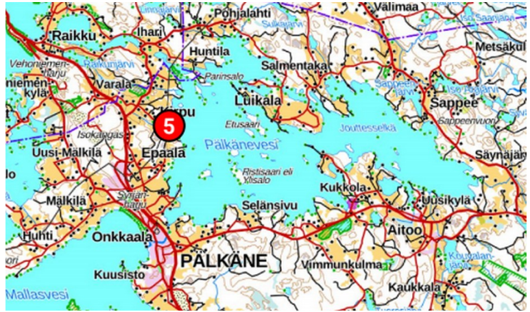
Kirvunoja sijaitsee Pälkäneveden länsirannalla.

Keväällä 2021 ja 2023 otettujen ojavesinäytteiden mukaan Kirvunojan fosforipitoisuus oli 58 ja 36 mikrogrammaa litrassa. Vain kahdella muulla Pälkäneveden ojalla mitattiin yhtä suuria pitoisuuksia.