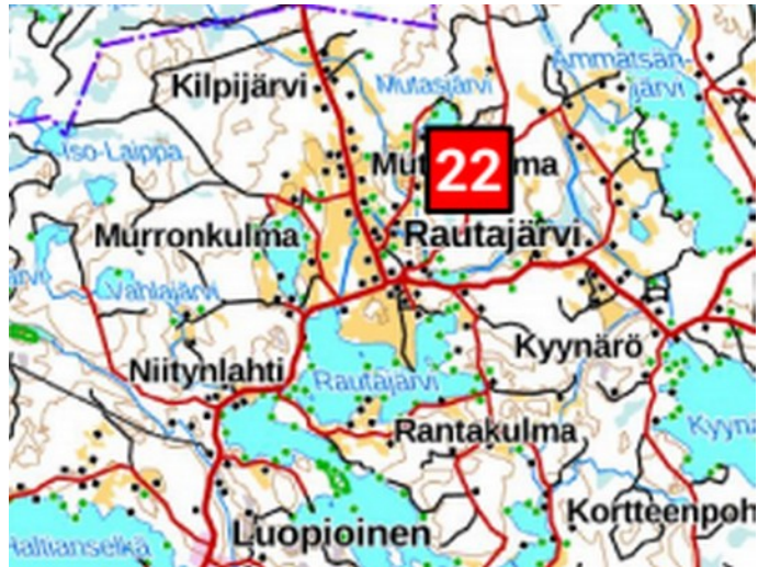
Sirinoja laskee Myllyjoen kautta Rautajärveen.