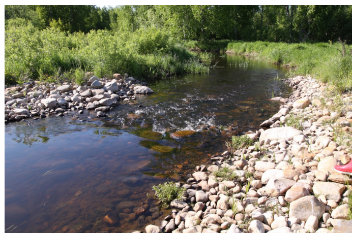
Myllyjoen alajuoksulle valmistui kosteikko alkuvuodesta 2022.