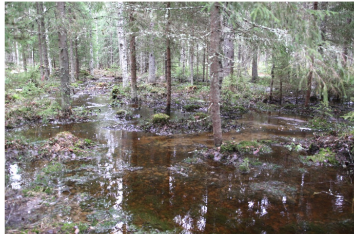
Kunnostamaton oja toimii pintavalutuskentän tapaan. Sen ansista osa kiintoaineesta ja ravinteista jää metsään.